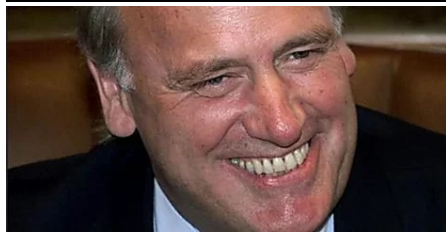
Mor als 72 anys l'exconseller Joaquim Molins