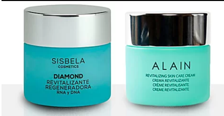
Mercadona ven per 5 euros una crema que en costa més de 60 a les...