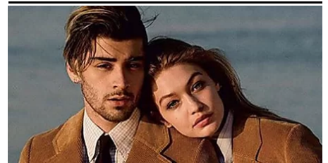
Así fue el último mensaje de amor de Gigi Hadid a Zayn Malik (La Vanguardia)