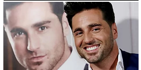
Manu Guix descarta emprendre accions legals contra Bustamante