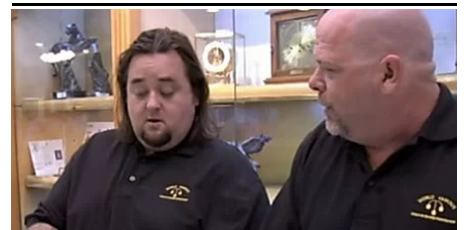
6 progrmas de la tele que se han descubierto que son falsos (Excite)