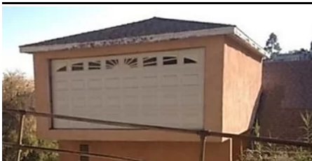
Estos arquitectos necesitan ser despedidos, pero ya (desafiomundial)