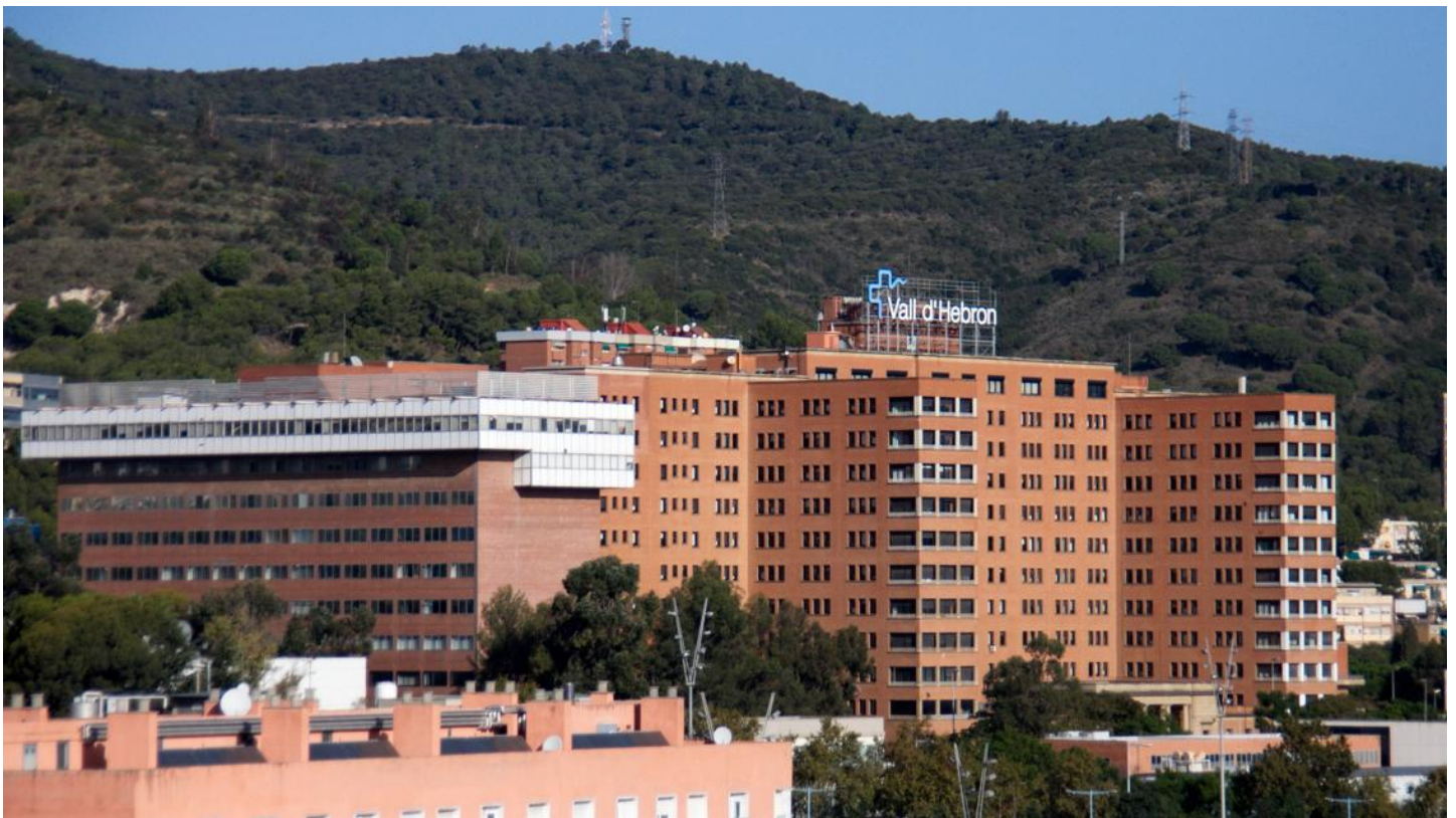
Hospital de Vall d'Hebron. // Amador Álvarez